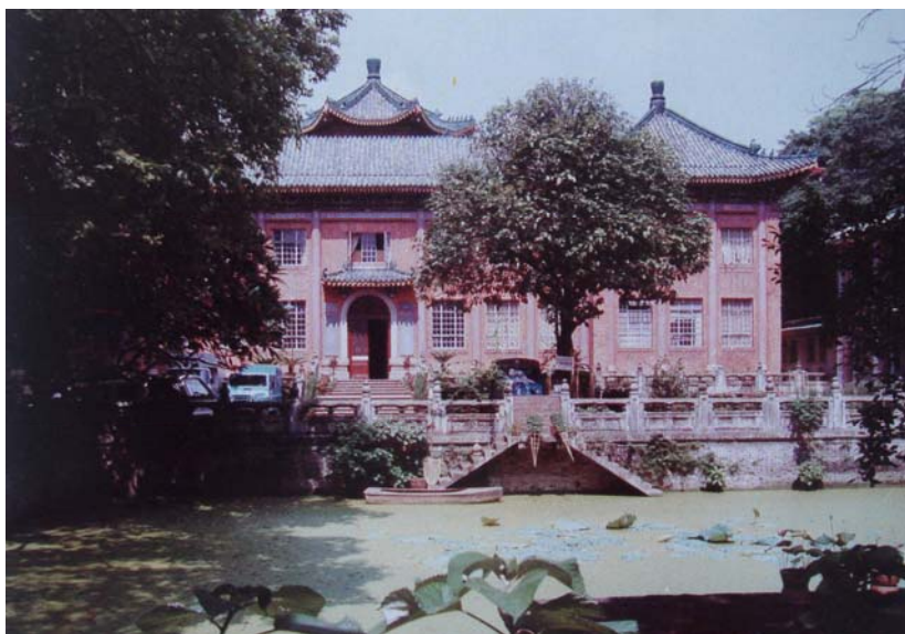
中山图书馆东立面，前为翰墨池