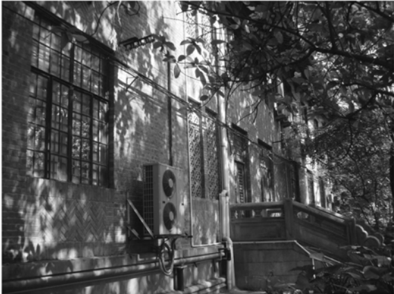
建筑学院办公楼南面次入口