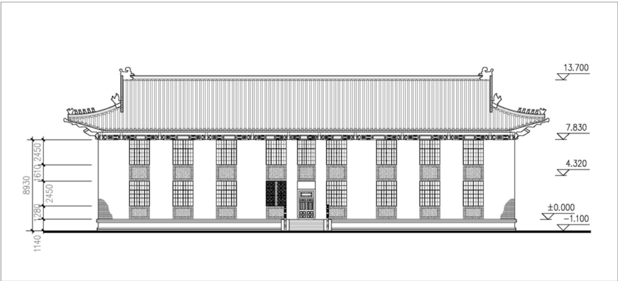
建筑学院办公楼南立面