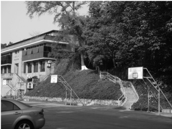
建筑设计院主楼与登山台阶