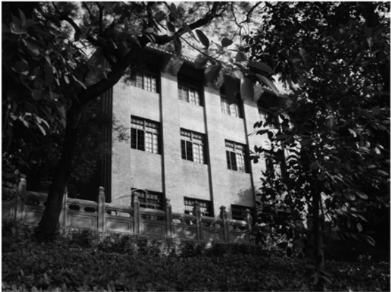
建筑设计院工作室西南角