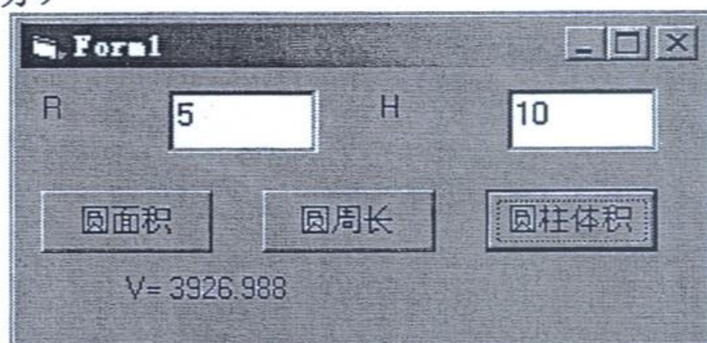
图 1 计算圆面积、圆周长、圆体积

其中：r 是半径，h 是高度。要求：(1)可以在该窗体中用文本框控件输入任意数 r 和 h；(2)用 3 个命令按钮的单击事件分别触发上述 3 个子过程，并在一标签控件内显示计算结果。执行结果如图 1 所示。（8 分）