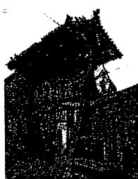
太原古清真寺 (唐代贞元年间创建)