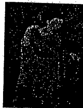
第一组 唐代的妇女(之一)