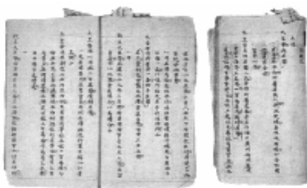
《南京条约》抄件 “万年和约”，还是千年变局？