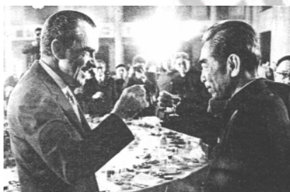
1972 年周恩来与尼克松在宴会上 跨越太平洋的碰杯