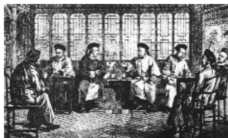
总理衙门大臣在议事 顶戴花翎与“自强”“求富”