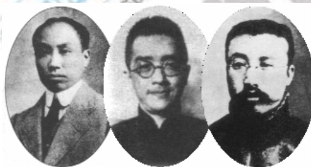
陈独秀 胡适 李大钊 呼唤“德先生”和“赛先生”