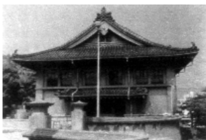
签订《马关条约》的日本马关春帆楼 闯入中国的“春帆”不仅是日本