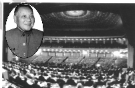
中国共产党十一届三中全会 解放思想，实事求是